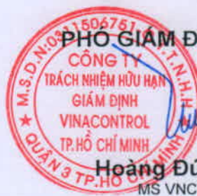
Hoàng Đức Hiệp MS VNC1058

Thông tin về mẫu được ghi theo yêu cầu của khách hàng. Các kết quả chỉ có giá trị trên mẫu thử nghiệm, dựa vào năng lực và hiểu biết tốt nhất của chúng tôi tại thời điểm thử nghiệm. Hết thời hạn lưu mẫu, Vinacontrol không chịu trách nhiệm về việc khiếu nại kết quả thử nghiệm của khách hàng. (*) Phép thử được công nhận VILAS (ISO/IEC 17025); (**) Phép thử sử dụng nhà thầu phụ; (#) phép thử được các Bộ, ngành chỉ định; LOD: giới hạn phát hiện; LOQ: giới hạn định lượng.