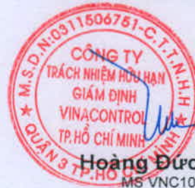
Hoàng Đức Hiệp MS VNC1058

Thông tin về mẫu được ghi theo yêu cầu của khách hàng. Các kết quả chỉ có giá trị trên mẫu thử nghiệm, dựa vào năng lực và hiểu biết tốt nhất của chúng tôi tại thời điểm thử nghiệm. Hết thời hạn lưu mẫu, Vinacontrol không chịu trách nhiệm về việc khiếu nại kết quả thử nghiệm của khách hàng. (*) Phép thử được công nhận VILAS (ISO/IEC 17025); (**) Phép thử sử dụng nhà thầu phụ; (#) phép thử được các Bộ, ngành chỉ định; LOD: giới hạn phát hiện; LOQ: giới hạn định lượng.